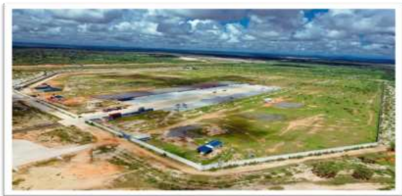
Muonekano wa eneo la Bandari Kavuu Kwala mkoani Pwani