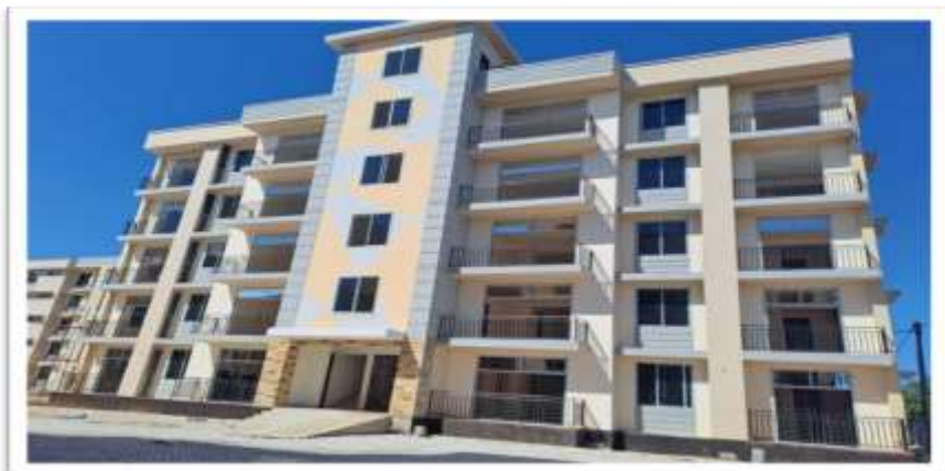
Mradi wa ujenzi wa nyumba eneo la Chamwino Dodoma