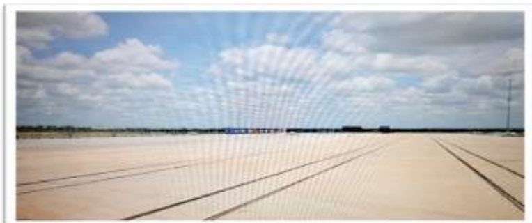
Eneo la Bandari Kavuu Kwala mkoani Pwani

115. Mheshimiwa Spika , Mpango Kabambe huo unahusisha eneo lenye ukubwa wa hekta 181,130 linalojumuisha vijiji 30 vya Halmashauri za Wilaya za Kibaha ( 16 ), Chalinze ( 9 ) na Kisarawe ( 5 ). Uanzishwaji wa Jiji hilo unalenga kupata eneo kubwa zaidi la uwekezaji wa viwanda na shughuli nyingine za kiuchumi na pia kupunguza msongamano wa shughuli mbalimbali za kiuchumi katika Jiji la Dar es Salaam ikiwemo bandari ya Dar es Salaam. Kazi ya kuandaa Mpango huo inaendelea.