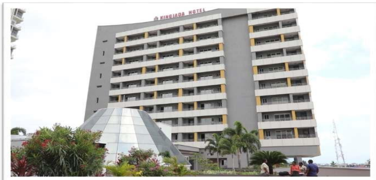
Hotel ya King Jada ni moja ya majengo ya Mradi wa Morocco Square jijini Dar es salaam

112. Mheshimiwa Spika; Shirika limeendelea na uuzaji na upangishaji wa majengo katika Mradi uliokamilika wa Morocco Square, ambapo katika jengo lenye nyumba za makazi 100 , tayari nyumba 71 zimeshauzwa na mauzo ya nyumba zilizobakia yanaendelea. Aidha, upangishaji wa Hoteli yenye vyumba 81 umefanyika kwa asilimia 100 , Maduka (Retail Mall) asilimia 94 na ofisi asilimia 42 .