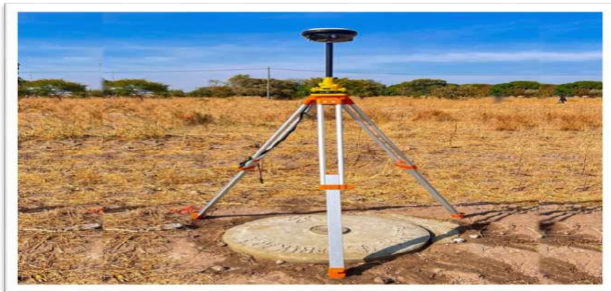
Alama za Msingi za upimaji wa ramani.

Kigoma (12), Geita (24), Kagera (12), Kilimanjaro (10) na Shinyanga (47) na hivyo kuwa na jumla ya Alama za Msingi za Upimaji 1,423 . Katika mwaka 2024/25, Wizara itaweka alama mpya za msingi 150 katika Halmashauri mbalimbali nchini. Lengo la Wizara ni kuwekeza zaidi kwenye usimikaji wa Vituo vya Kielektroniki vya Upimaji ( Continuously Operating Reference Station- CORS ) ambavyo vitawezesha kazi za upimaji kufanyika kwa ufanisi zaidi.